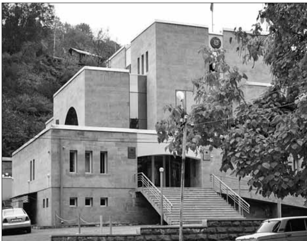
Սյունիքի մարզի ընդհանուր իրավասության դպրարանի նորակառույց շենքը

Սկսենք «Թշվառականը» հոդվածը կրկին ընթերցելուց (էջ 6):